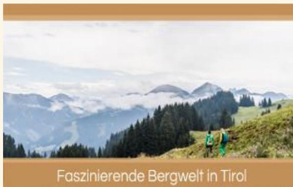
Faszinierende Bergwelt in Tirol