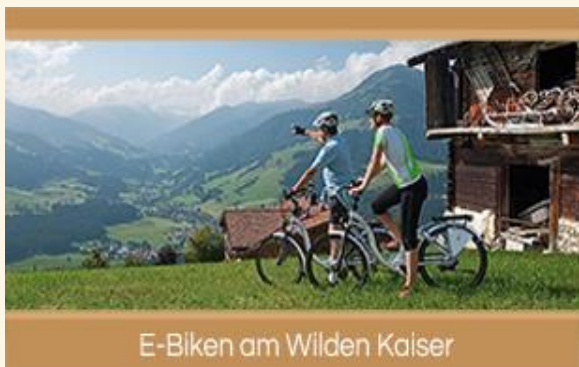
E-Biken am Wilden Kaiser